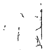
Tavola rotonda interattiva